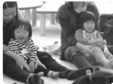
なかよし親子で ふれあい遊び