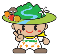
豊丘村キャラクター「だんQくん」