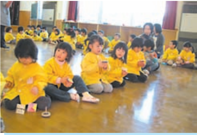
▲コマ回し、上手だよ!!