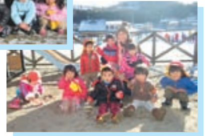
▲寒くてもへっちゃら♪ お外大好き♥