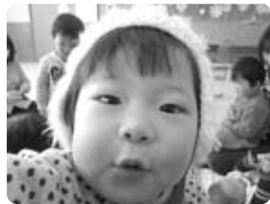
絵本を見て大喜び

近年国際的な学力検査で日本の子ども達の学力低下が大きな問題となっていますが、このことと世界一長いと言われる日本の子どもたちのメディア接触時間とが深く関係しているのは疑いのないことでしょう。ここ数年全国各地で急激に増えている「ノーテレビ・ノーゲーム」「アウトメディア」の活動に取り組んだ小・中学校で学力が目に見えて向上しているのはそのことを裏づけているのではないのでしょうか。