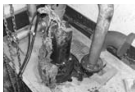
揚砂ポンプにタオルが絡んでいる状況(負荷警報が発生)