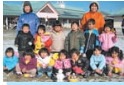
▲やっと雪が降ったよ～、ヤッター😊