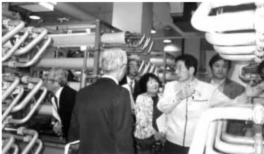
上水道、浄化処理施設にて

三日目は香川県善通寺市にあ る公設民営の保育園「カナン子 育てプラザ21」を視察した。今、 多くの自治体で検討されている 保育園の民営化の実状を見てき た。善通寺市は人口三万五千人 の町で、保育園は公立が四ヶ所、 民間が三ヶ所と なっている。市 は平成十三年に 四億七千万をか けこの保育園を 建設し、運営主 体を民間に委託 した。市民(特 に父母)の反応 は、民間になる と保育の質、給 食の質が公立に 比べ落ちるので はないかという 声が多かつたと いう。しかし、 それも体験を通 し、又、アンケ ー調査等を実施 し行政が行うメ ニューだけでなく、 ニューが民間で