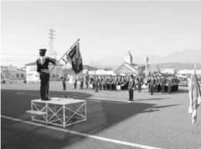
むずかしくなる団員確保（出初め式）