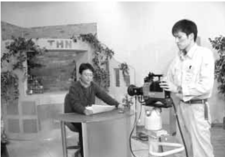
放送施設は整ったが、通話が課題

成立していると思うが、タクシー料金の値上げが認可され、三月末までには千六百万位になることが予測されている。契約金額をオーバーする分について、どのような支払いをしていくのか。 村長 契約金額を利用料金が下回った時は減額変更をすることになっている。増額の場合は特に規定がない。タクシー会社とは協議を重ねている。