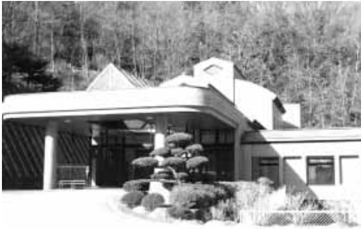
北部地区で年間400人が利用している飯田市火葬場