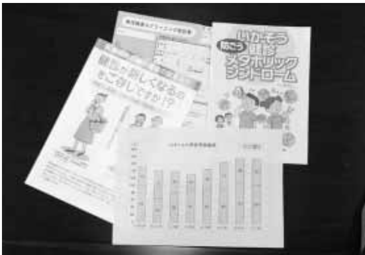
4月から変わる成人病検診

質問 多重債務者が急増し社会問題となつてきている。日本全体では千四百万人が消費者金融を利用、二百万人の多重債務者がいると言われ、政府も対策をたて有識者会議ではその一環として、