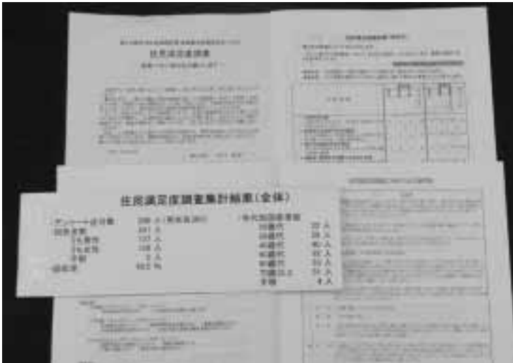
調査結果まとまる

等が考えられる。信頼や連携がまだ十分でないと感じ止める。 質問 保護者の要望等は、どのような形で掌握しているか。 教育長 直接寄せられる場合もあるが、主には毎月の教育委員会で校長から報告を受ける。 要望 一生懸命子供を育てたいからこそ、学校への要望不満も出てこようかと思う。その観点から対応を願いたい。