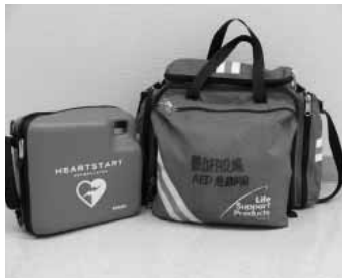
使える人がふえてほしいAED

村長 人によって合わない事もある。その人に合ったものを考え自分で管理する事が大事。遊具を置く事は疑問である。