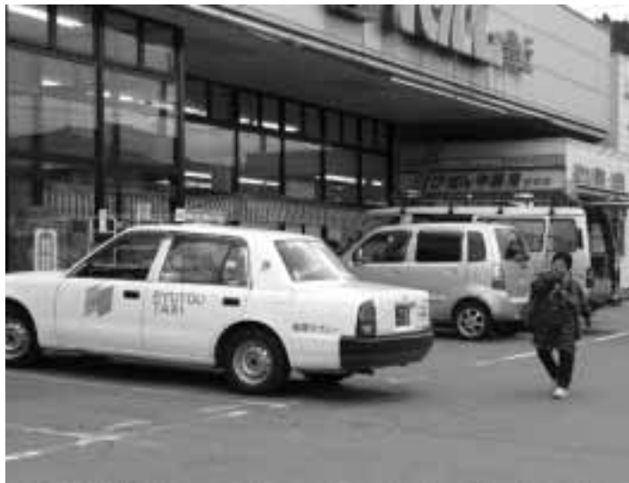
大切な移動手段になっている福祉タクシー