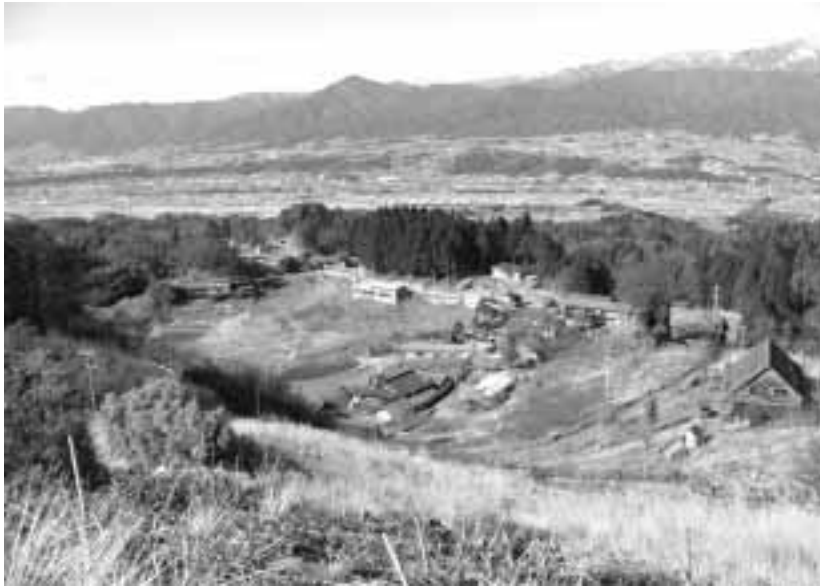
地形的な差はあるが平等感が望まれる (本村地籍)