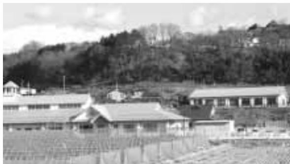
太陽光発電設置予定施設(中央保育所・スポーツ館)