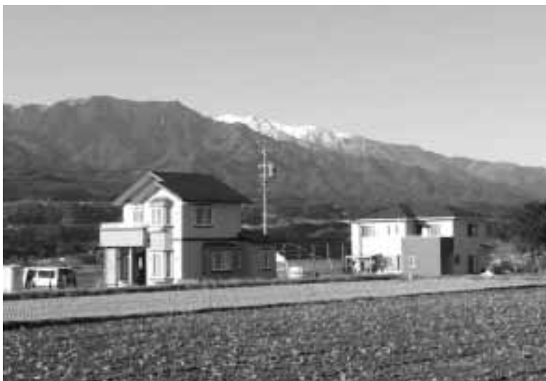
健全財政とともに、戦略的事業展開を (中平団地)

総務課長 実質公債費比率は、十八年度十二・六%。実質赤字比率はゼロ。連結実質赤字比率もゼロ。将来負担比率