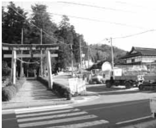
河野黒谷線工事現場

村長 今年の二月、県よりこの取扱いについて調査があった。今年度から要介護度に加え、障害高齢者、認知症高齢者の日常生活自立度を加味して認定証を交付していきたい。 住民課長 県下八十一市町村中、当村を含め十一市町村が見直しを求められた。要介護四と五以外の人の判定について今後検討をしている。