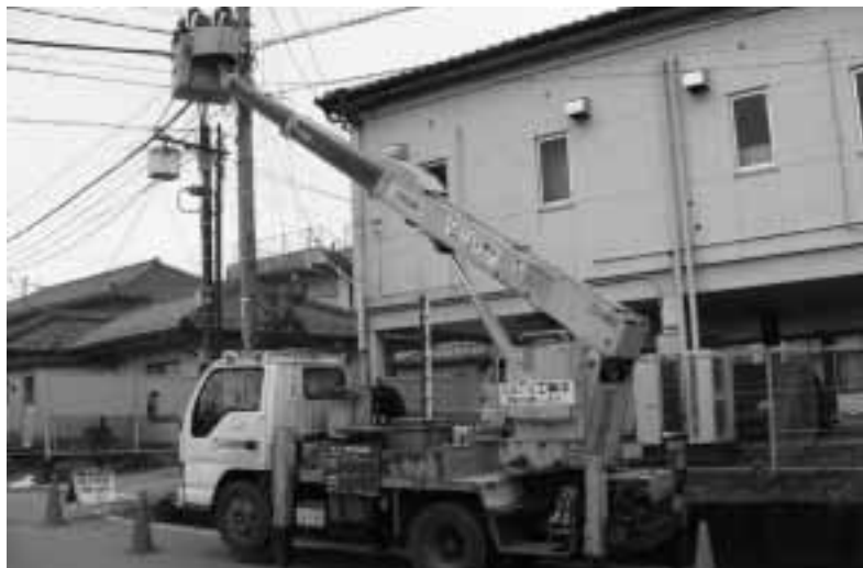
着々と進む有線デジタル化の工事

村長 このあいだ報告したどぶろく特区の認定など良い話もある。特産にするにはハードルが高いがそういうものの伸びるような支援をしたい。