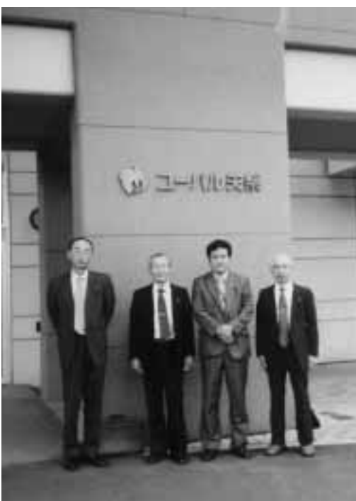
住民参加の様子を視察

合併をしない宣言で有名になった矢祭町は自立の取り組みで、職員を五年間で半減、誕生祝金、妊婦検診費助成、保育科の半減化、二千人規模の工場誘致に成功する等の成果が上がっている。二つの町村共、住民が自治に参加することにより意識改革が進み、村づくりや自立に取り組んでいる。当村でも住民が参加する自治に向けて、長期的な取り組みが必要なことを感じた。