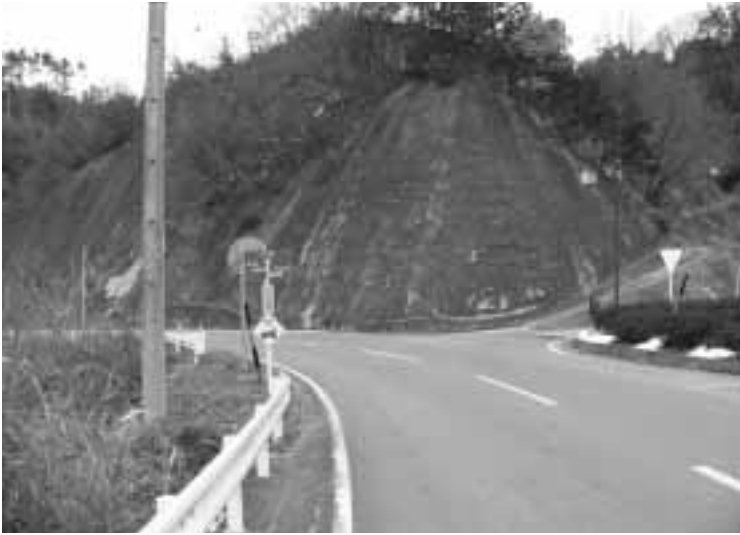
現在の道路標識の様子

村長 今の地下水源は汚染の危険性がある。今は悪化物質を科学的に除去もできる時代になった。河川水を取るのがいいか、科学的な処理で間に合わせるか総合的な判断が必要と考えている。積立金は河川水源を想定して水道料金の引上げをした経緯がある。施設更新の原資も必要で、分離して積み立てるべきか内部で検討して行きたい。