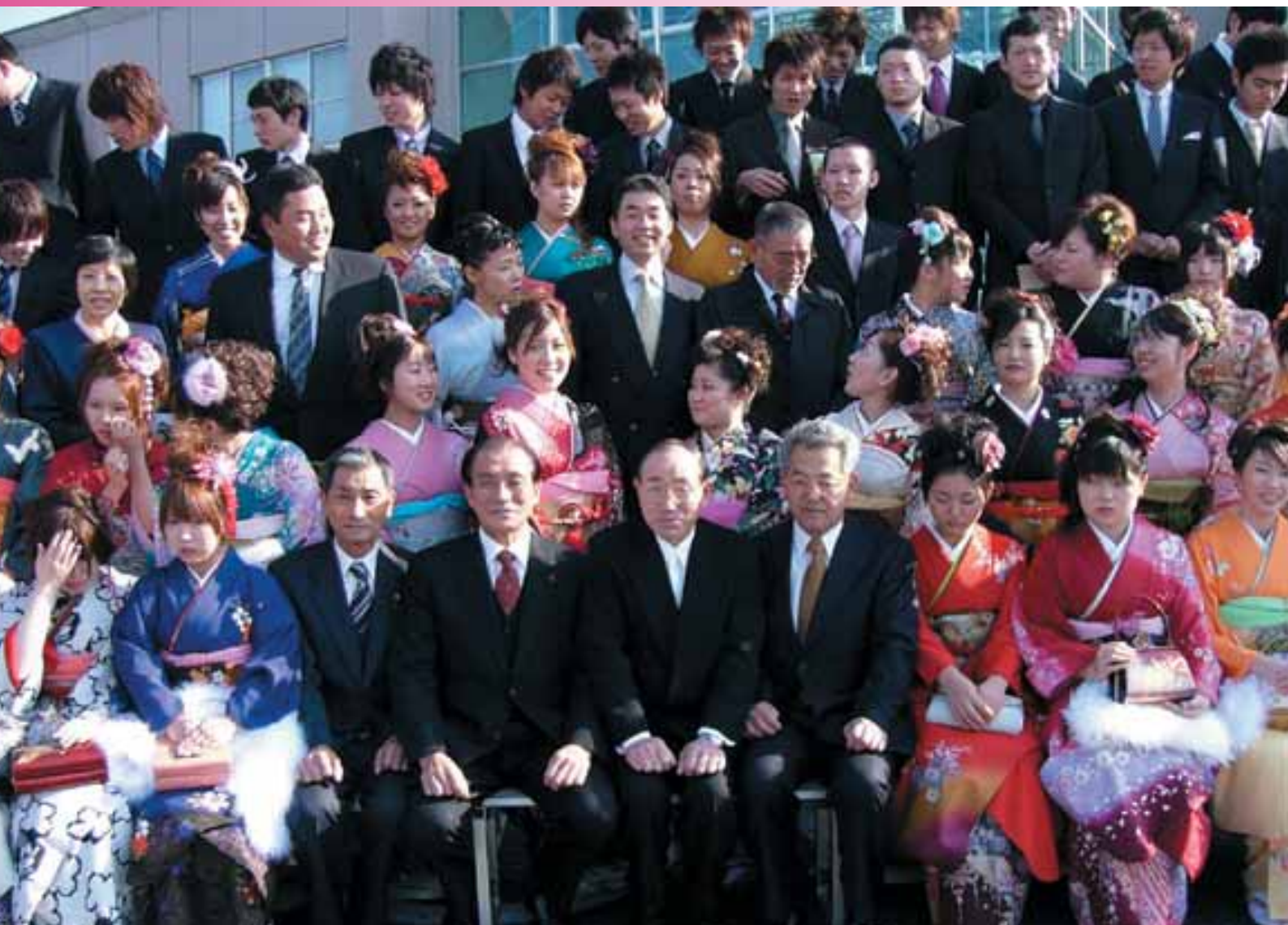
平成19年 1月 3日 成人式行なわれる