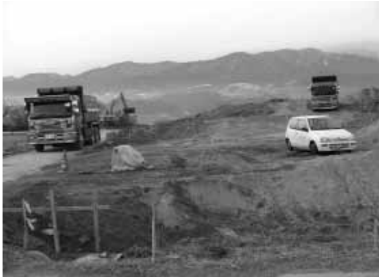
建設工事が始まった中平住宅団地

当初希望の六名の方々については、計画中止の時点で電話でお断りをしたが、指摘の通り大切な六名であるので、今後フォローをしていく必要があると考えている。