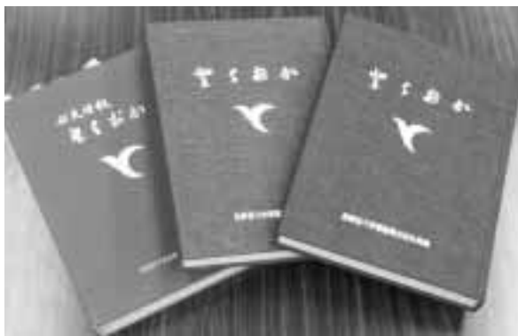
今まで発刊された 三冊の館報縮刷版

いては公費で購入する分(学校や図書館に置く分)に当てたい。四百部と言うのはかなり厳しいものがある。前回同様、編集委員会の皆さんに協力してもらいなんとか売り残りが無いよう事務局でも考えている。 丸岡議員 縮刷版を出すという事は、最近その計画が持ち上がったのか、あるいは年度当初より計画があったのか。 教育委員会事務局長 当初より今回の縮刷版の発刊は、予定していた。