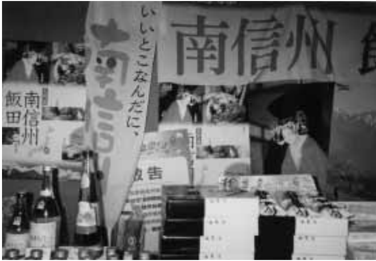
大盛況だった南信州フェア (台北市にて)

憲法九条をめぐる、かまびすしい論議の中、史上最も悲惨な戦いといわれる沖縄戦を現地ですら直接感じて来ました。 昭和二十年四月一日に五十万余りのアメリカ軍の上陸と攻撃が沖縄本島に対して始まりました。 本土決戦の前に少しでもアメリカ軍に損害を与えるために、大本営からは最後の一兵まで戦えと指示されていたのです。 特に沖縄南部では日本軍と住民が入り交じった状態で激戦が行われたため、九十日間に一般住民九万四千人、日本兵六万六千人、沖縄出身兵二万八千人、米兵一万二千人が亡くなりました。沖縄県民の四人に一人が亡