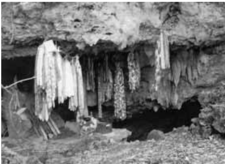
糸数アブチラガマの出口には今も千羽鶴が

等品の品質にはバラツキが多く、チリ産のりんごこと比べても見劣りがする。残留農業への気配りをもとより、品揃えに気配りが大いに求められるとの指摘もあった。