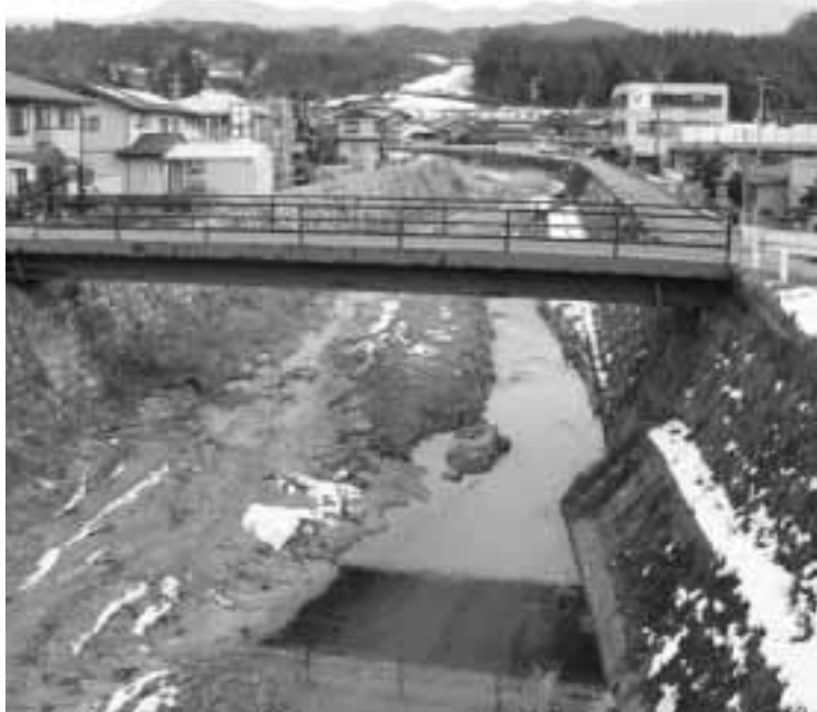
改修工事が決定した芦部川付近

脱ダム宣言で郷土沢ダム建設が中止となり、利水（水道水源）が中流の芦部川）の再検討のため、平成十五年十二月に郷土沢川流域協議会が発足しました。