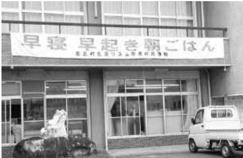
福祉センターにも横断幕が

南小学校での調査の結果を見ても、摂取の食品量と子供達の集中力、意欲、情緒の安定度、もう一つは教科の成績との因果関係が、中央の学者の発表としている結果と見事に一致した。非常にショックなことだった。食の改善は子供達のみならず、生活習慣病予防の見地からも、そしてメディア漬けの改善も、村民運動として盛り上げ、子供の成長あるいは自分の生活スタイルに正しいリズムを整えて、健康で楽しく長生きする。そんな豊丘村にしたい。