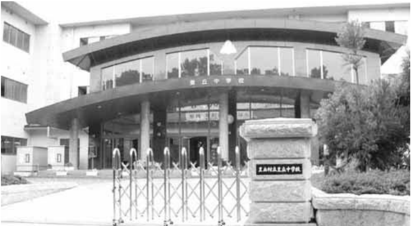
豊丘中学校新校舎の正面玄関