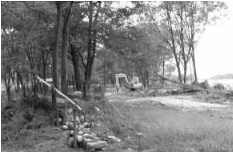
災害で被害を受けたアカシアマレット場

産業建設課長 豊丘の崩落危険箇所は十九箇所。県に申告してある。四箇所は改良済みだが残りすべてに対応は無理、村単独での対応についても無理。