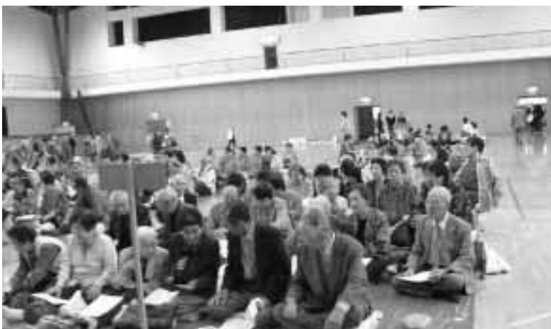
平成18年度の村の敬老会が村体で開かれた

質問 介護保険制度の見直しによつて、この十月から要介護軽度者は介護用機器（電動ベット・車イス等）の保険利用が制限され購入するか、レンタル料の全額を負担しなければならぬ。