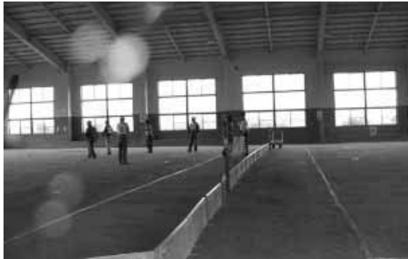
多くの人たちに利用されているスポーツ館

教育委員会事務局長 予約の取り方等含め、村民の人たちにも使ってもらえるような方策を検討していきたい。