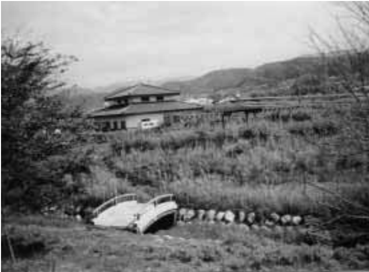
河野の農業集落排水

産業建設課長 現在モシルバー人材センターに草刈りは委託している。ただし処理場の中については、年二回ほど草や周りの植栽の枝を刈ったり、芝を刈る仕事は職員がしている。