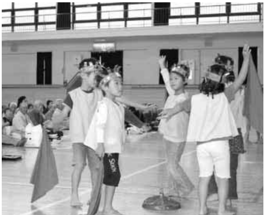
敬老会での園児のダンス

助役 村でも有線を利用するようになっている。故障した場合、在庫も少なく、いつ壊れるかも予測がつかない状況である。唐澤議員 保守点検はしている